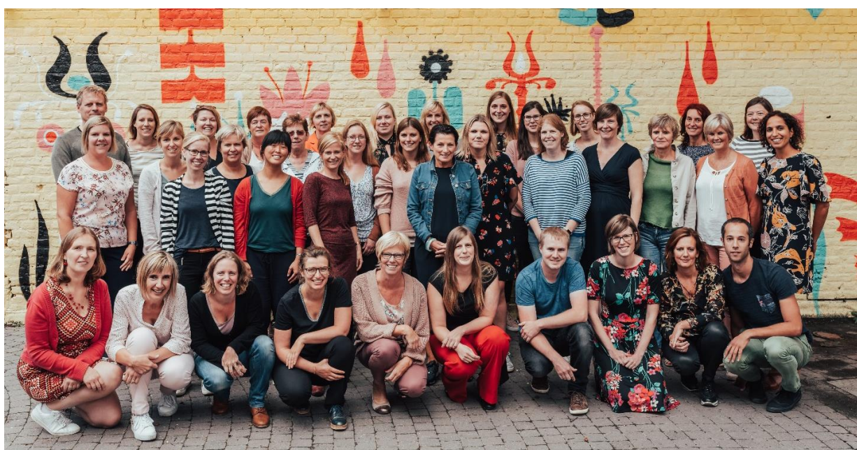
SANCTA MARIA BASISCHOOL- INFOBROCHURE - PRAKTISCHE INFORMATIE